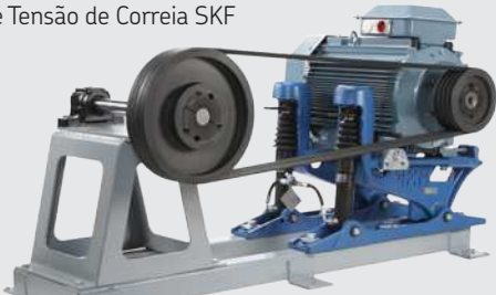
Sistema de Tensão de Correia SKF