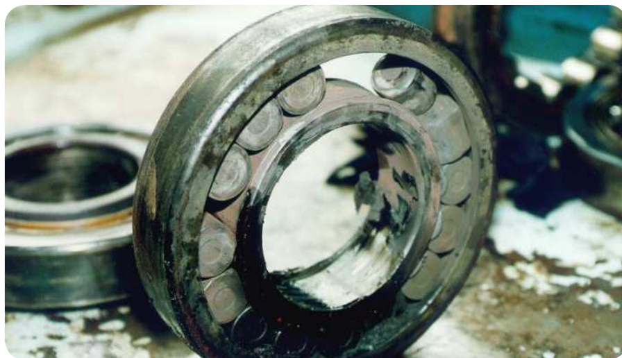
Ett exempel på ett totalhavererat cylindriskt rullager med hållarblockage. Denna typ av skada går ej att analysera.

Alla dessa skadesituationer efterlämnar ett unikt skademönster i lagret. Skadan kan klassificeras enligt ISO som primär-