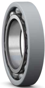
INSOCOAT Lager mit vorheriger Beschichtung