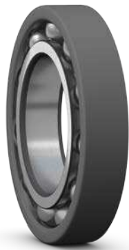
INSOCOAT Lager mit verbesserter Beschichtung