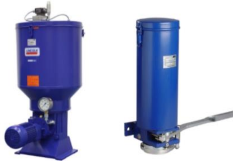
Pompe ZPU Pompe HJ 2

SKF Lubrication Systems Germany GmbH Heinrich-Hertz-Strasse 2-8, 69190 Walldorf, Allemagne