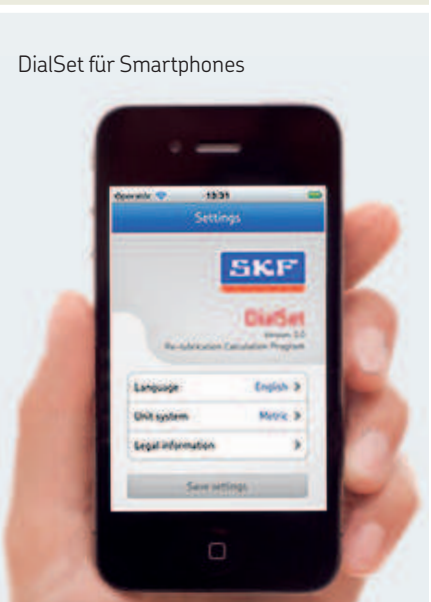
DialSet für Smartphones