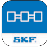
App für Maschinenzüge* Ausrichtung von Maschinenzügen mit mehreren Kupplungen