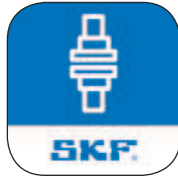
App für vertikale Wellen Ausrichtung von Maschinen mit vertikalen Wellen