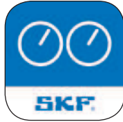
Werte-App* Messköpfe wie digitale Messuhren einsetzen