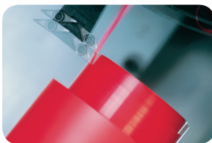
Sistema SKF SEAL JET