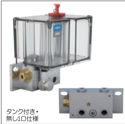
タンク付き・無し1口仕様