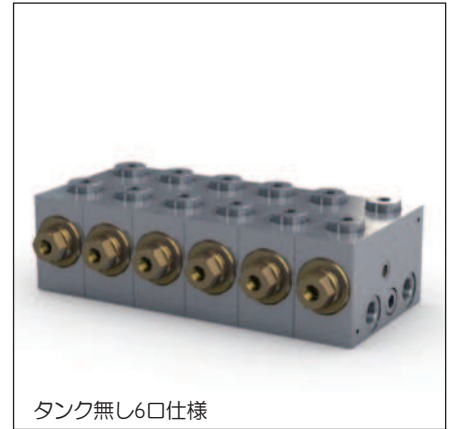
タンク無し6口仕様