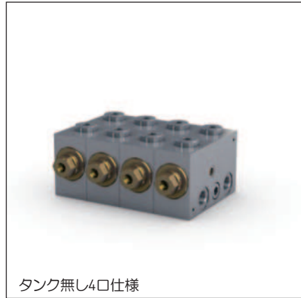
タンク無し4口仕様